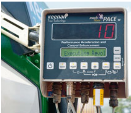
Damit eine Ration wie die andere schmeckt, gibt das Programm „PACE“ beim Mischen – wie hier mit der „10“ – exakt die noch zu absolvierende Zahl an Umdrehungen vor. Der Speicherstick befindet sich in der „Filmdose“.