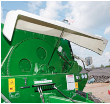
Der Antrieb der Mischhaspel und der Austragschnecke erfolgt von vorne über die Schlepperzapfwelle mit 540 min -1 .