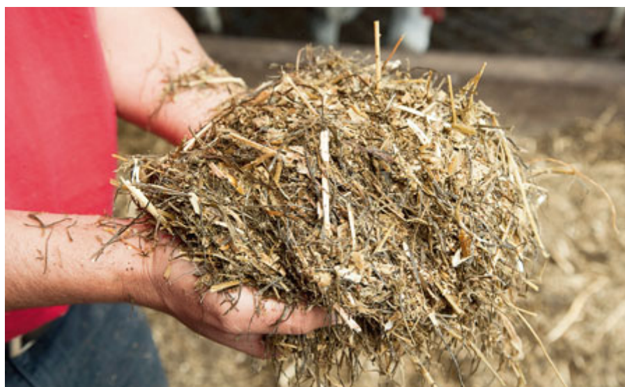
Das Maschinenkonzept „Mech-Fiber“ und die Managementhilfe „PACE“ ermöglichen das ganze Jahr über eine gleichmäßige Struktur und Zusammensetzung des Futters.

„Falsch!“ – Lautet an dieser Stelle der Zwischenruf von Keenan. Denn entscheidend ist nicht der Milchertrag, sondern die Futtermittelverwertung. Und diese erklärt sich aus dem Verhältnis von Ertrag „Energiekorrigierter Milch“ zum eingesetztem Futter.