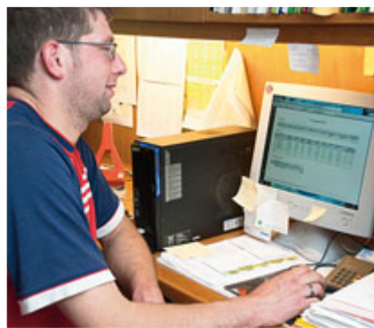
Einmal um die Welt: Mit PACE wird jede Veränderung der Ration in Irland mit neuen Mischzeiten versehen und prompt zurückgeschickt. Wer möchte, kann damit auch am weltweiten Keenan-Netzwerk teilnehmen.

ben ausgedrückt – der Lehrling am Sonntagmorgen beim Füttern macht, was er will – sich also weder beim Befüllen des Futtermischwagens noch bei den Mischzeiten an die Vorgaben hält? – Zum Kontrollieren und zum Optimieren der Ration unabhängig vom „Futtermeister“ entwickelte Keenan das System „PACE“. Es ist die Abkürzung für „Performance Acceleration and Control Enhancement“ und bedeutet übersetzt so viel wie „Die Steigerung der Leistung durch eine verbesserte Kontrolle“. Im Fokus stehen die Überwachung und Einhaltung der Ladesequenzen, die Mengen und Mischzeiten. Das Ganze funktioniert dabei so: