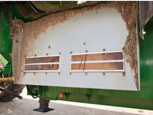
Die Futterrutsche kann hydraulisch verschwenkt werden. Die Magnete halten zumindest einen Teil metallischer Verunreinigungen zurück.