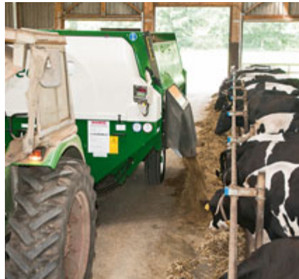
Dank der Austragschnecke legt der Wagen ein sehr gleichmäßiges Futterschwad auf dem Tisch vor den Tieren ab.

Die Öffnungsweite ist vorn links am Wagen an einer guten Skala ablesbar. Das Futter wird aus der Kammer an die Schnecke übergeben und nach vorn zur Luke transportiert. Über eine ebenfalls hydraulisch einstellbare Rutsche gelangt das Futter auf den Tisch. Dank der Ausfütterschnecke wird das Futter in einem gleichmäßigen Schwad abgelegt.